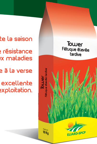
Sacherie 10 kg

Démarre tôt avec une excellente souplesse d'exploitation.